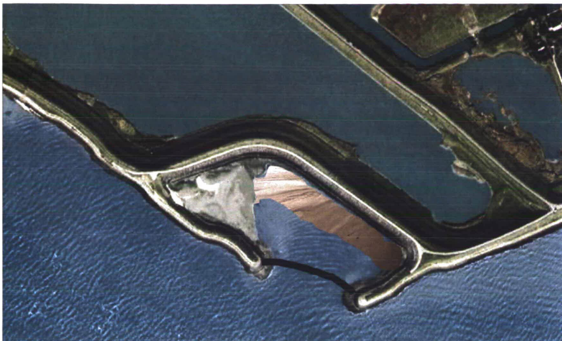
Zandsuppletie c.a. 30m breed, 300m lang en 1m hoog (van -0,8 NAP naar +0,2 NAP) Van oost naar noordwest bekeken