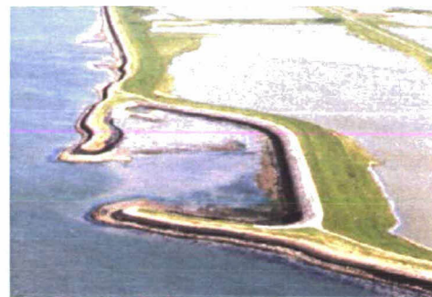
Figuur 1.2. Dijkval tijdens laag- en hoog water. Strandje aan de westkant valt droog.