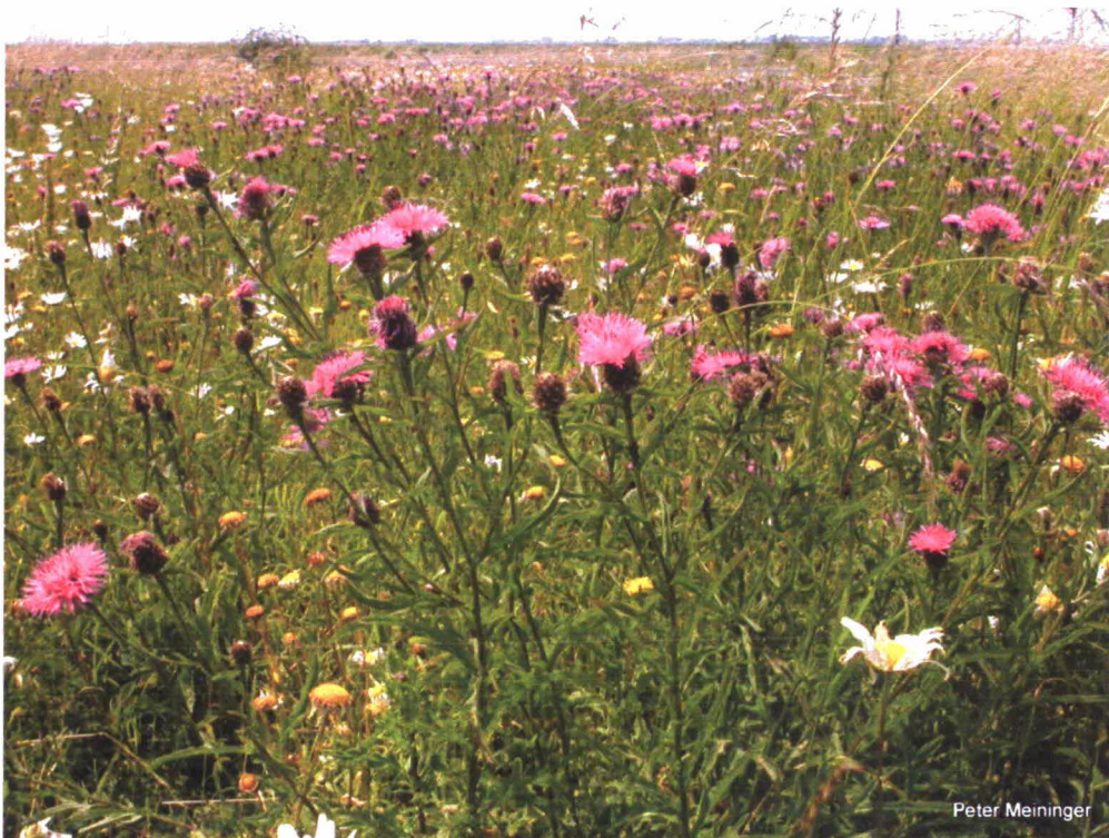
Foto 4. Knoopkruid. Driehoekig veldje noordwestelijke strekdam (gebied 5).