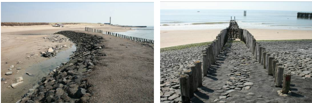
Figuur 1.2 Impressie gebied

De werkzaamheden gaan plaatsvinden tussen dijkpaal 211 en 228. De lengte van het dijktraject bedraagt ongeveer 1,4 kilometer. In bijlage 1 is een tekening van het dijktraject opgenomen waarop de begrenzing en indeling van het dijktraject is terug te vinden. Aan de zuidzijde grenst het projectgebied aan duingebied, een traject dat niet door het Projectbureau Zeeweringen wordt aangepakt. Aan de noordzijde gaat het dijktraject van Het Gat van Westkapelle over in de Westkapelse Zeedijk. Dat dijktraject is in 2006/2007 verbeterd. Het dijktraject ligt vlakbij Natura 2000-gebied 'Voordelta' maar grenst direct aan Natura 2000-gebied 'Westerschelde & Saefthinghe'.