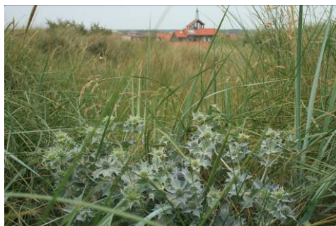
Figuur 4.1 Blauwe zeedistel langs traject