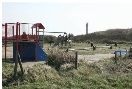
Figuur 1.3 Westkapelle achter dijktraject

De oostkant van de zeewering bestaat hier verder uit een smalle duinstrook met wandel- en fietspaden, die op zijn beurt begrensd wordt door de Westkappelse Kreek.