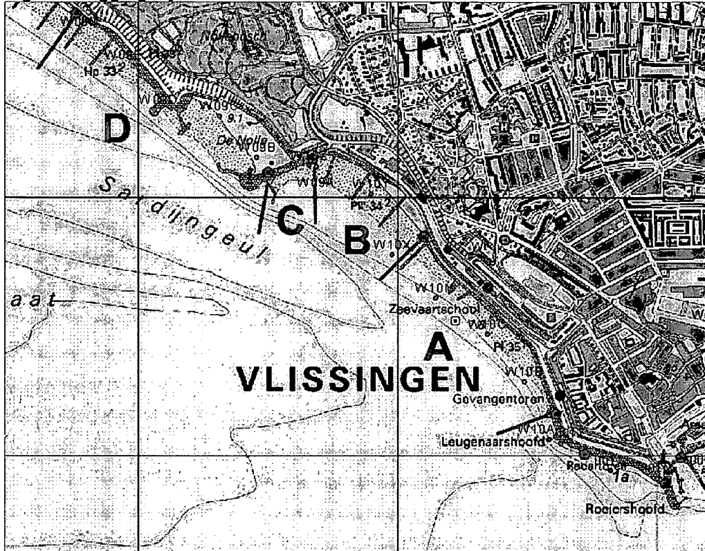
Figuur 1 Ligging dijkvakken