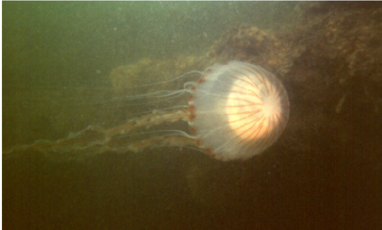
Kompaskwal in de Oosterschelde, een gekleurde kwal met lange tentakels.... niet aanraken dus.

Niet stekende kwallen zijn doorzichtig. Deze kwallen hebben geen lange losse tentakels en hebben weinig tot geen kleur. Een voorbeeld is de Oorkwal, die de laatste tijd veel in het Veerse Meer voorkomt. Deze is te herkennen aan de vier witte rondjes in het midden van de kwal, zie de foto's.