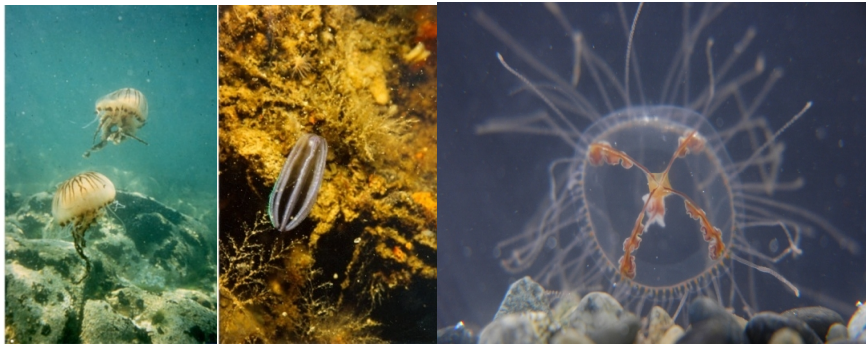
Links een Kompaskwal, midden een Meloenkwal (ribkwal) en rechts een Kruiskwal (vergroting).

De ribkwallen zijn doorzichtig en vertonen in het zonlicht witte strepen. Ribkwallen komen in Zeeland veel en vaak voor, maar vallen weinig op. Ze hebben geen netelcellen en steken niet. De Kruiskwal hoort bij de medusen, een aparte groep.