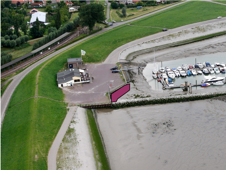
Figuur 2. Ligging van het projectgebied