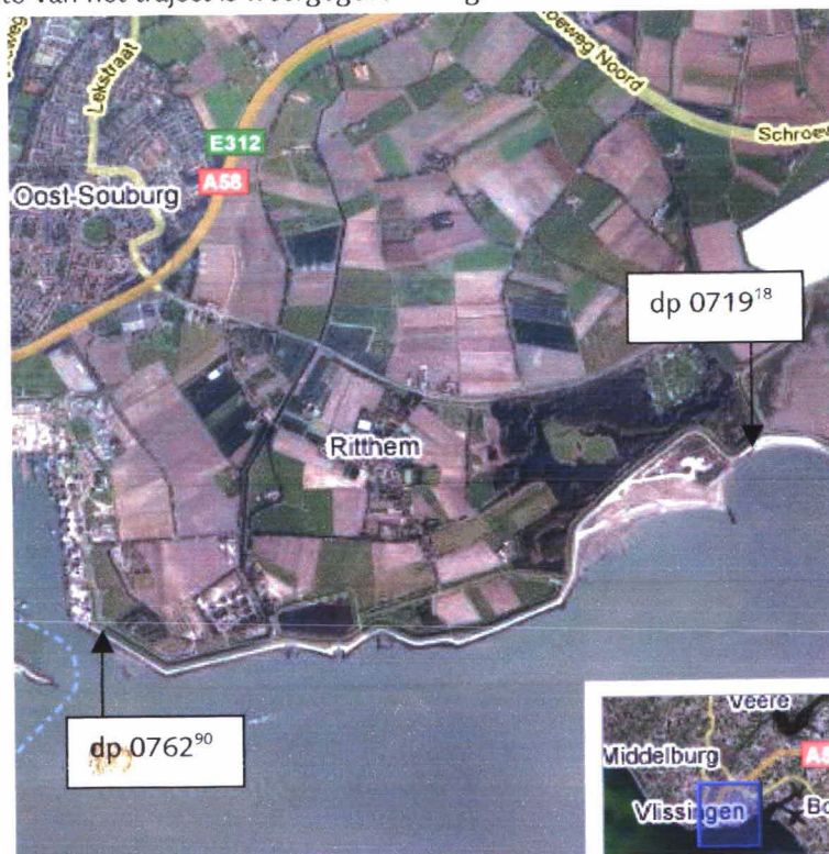
Figuur 1: Luchtfoto Zuidwatering dp 0719 18 – dp 0762 90

Een luchtfoto van het traject is weergegeven in figuur 1.