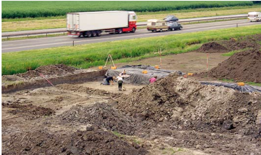
Bij de aanleg van de Betuweroute werd gewerkt in de geest van Malta

wordt het archeologische belang ingevlochten in de regelingen die betrekking hebben op ruimtelijke processen en de uitvoering daarvan. Hoewel in de Nederlandse praktijk het verschijnsel archeologie vooral zichtbaar is bij opgravingen, is de Wet op de archeologische monumentenzorg met nadruk geen opgravingswet. Hierna volgt een toelichting op de belangrijkste thema's van de wet, die grotendeels in de Monumentenwet 1988 zijn opgenomen. Aan het eind van deze brochure staan indexen op artikel en onderwerp van de wet.