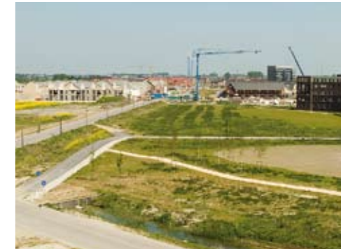
Hoe er met archeologische sporen in een bestemmingsplan rekening wordt gehouden bepaalt de gemeente

Sluitsteen van de archeologische bescherming met behulp van planologische voorschriften is dat een gemeente tegen overtredingen van deze voorschriften daadwerkelijk optreedt. In de handhavingsnota kan de gemeente beschrijven wanneer en op welke wijze de handhaving van de archeologievoorschriften wordt uitgevoerd. Daarnaast kan de minister gebruikmaken van de bevoegdheid om bij dreigende schade of schade aan een archeologisch monument voorschriften te geven aan de uitvoering van de schadeveroorzakende werkzaamheden en eventueel het werk stilleggen.