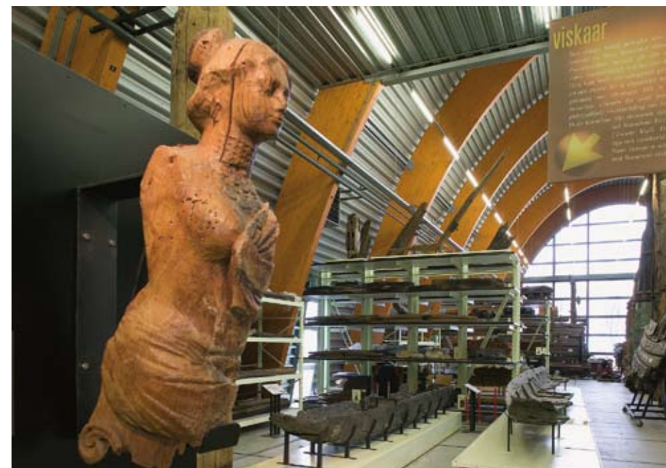
Het Nationaal Scheepsarcheologisch Depot is aangewezen voor de opslag van scheepsarcheologische monumenten