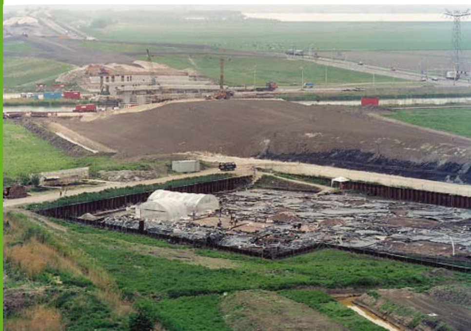
De rechtspersoon die profijt heeft van de bodemversturende activiteit is de verstoorder

Omdat in de meeste gevallen de provincies eigenaar zijn van de vondsten is in de wet bepaald dat deze een depot in stand houden waar archeologische vondsten en de opgravingsdocumentatie op een verantwoorde manier worden opgeslagen. Een gemeente kan er voor kiezen om een depot in stand te houden, maar dit depot zal dan wel erkend moeten zijn door de provincie. De minister heeft het Nationaal Scheepsarcheologisch Depot van de Rijksdienst voor Archeologie, Cultuurlandschap en Monumenten te Lelystad en Zeewolde aangewezen als depot dat geschikt is voor de opslag van scheepsarcheologische monumenten. Deze aanwijzing heeft consequenties voor scheepsarcheologische vondsten die een specialistische behandeling nodig hebben. Daarvan kan de minister bepalen