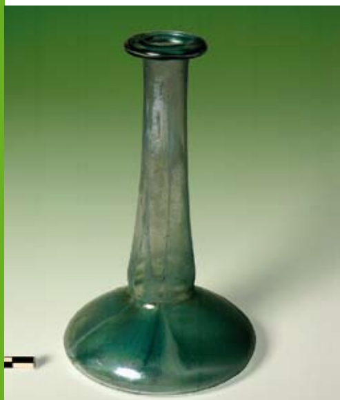
Een van de vele gerestaureerde voorwerpen uit een in Bochtoltz bij toeval gevonden Romeinse askist