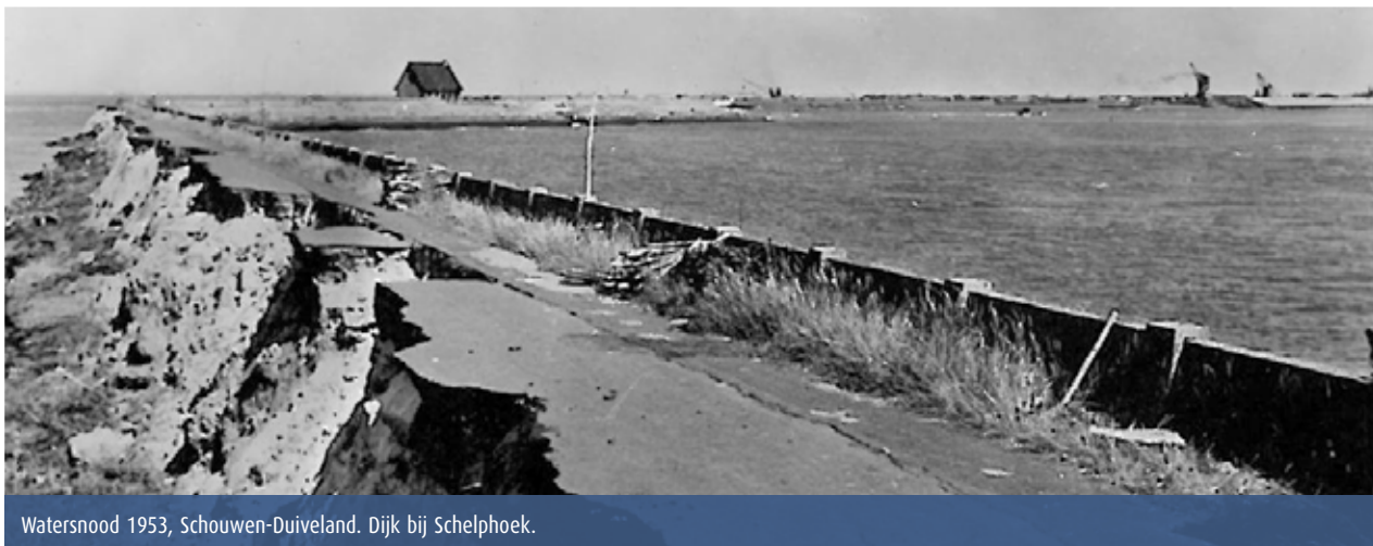
Watersnood 1953, Schouwen-Duiveland. Dijk bij Schelphoek.

Op de westnol bevinden zich bijzondere objecten uit het verleden, zoals een muraltmuur en restanten van een oud gemaal. Het projectbureau zet zich in om deze cultuurhistorische elementen te behouden. Om de muraltmuur niet te beschadigen, werken we eroverheen. Een extra uitdaging!