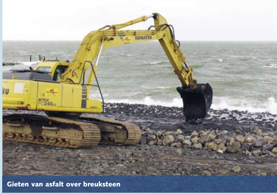
Gieten van asphalt over breuksteen

Naast het versterken van de dijk, doet het projectbureau nog meer. Zo repareren we het pad dat vanaf het fietspad achter de dijk naar het caisson in de voormalige werkhaven loopt. De parkeerplaats bij de boothelling asfalteren we opnieuw. Ook wordt de toegangsweg naar de westnol geasfalteerd. De berm die hierlangs loopt, passen we aan. Dit doen we om de dijk langs de Plompe Torenweg beter aan te laten sluiten op de dijk