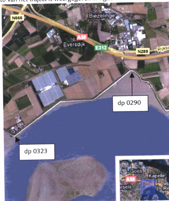
Figuur 1: Luchtfoto Willem-Annapolder dp 0290 – dp 0323

Een luchtfoto van het traject is weergegeven in figuur 1.