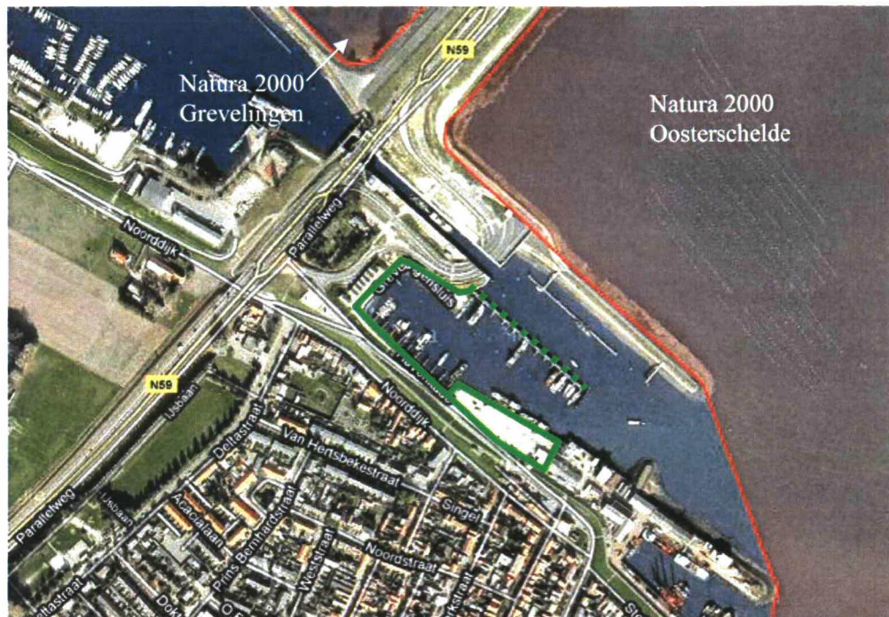
Figuur 1: luchtfoto van de haven van Bruinisse. Op de luchtfoto zijn nabijgelegen Natura 2000-gebieden rood weergegeven. De delen van de haven waar werkzaamheden voorzien zijn, zijn groen

epsWQuick scan natuurwetgeving werkzaamheden h