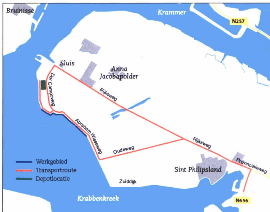
Dijktraject Willempolder / Abraham Wissepolder